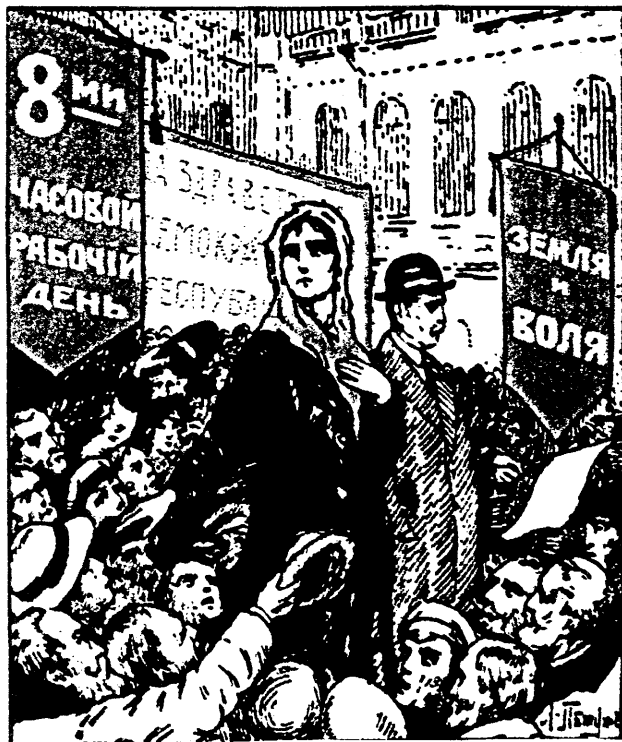
L. Petujov. "Igualdad de derechos de la mujer". Petrogrado. Tarjeta postal. 1917

Hay que plantearse muy seriamente cómo los comunistas, recogiendo lo dicho por nuestros grandes teóricos, hacemos un trabajo con las mujeres.