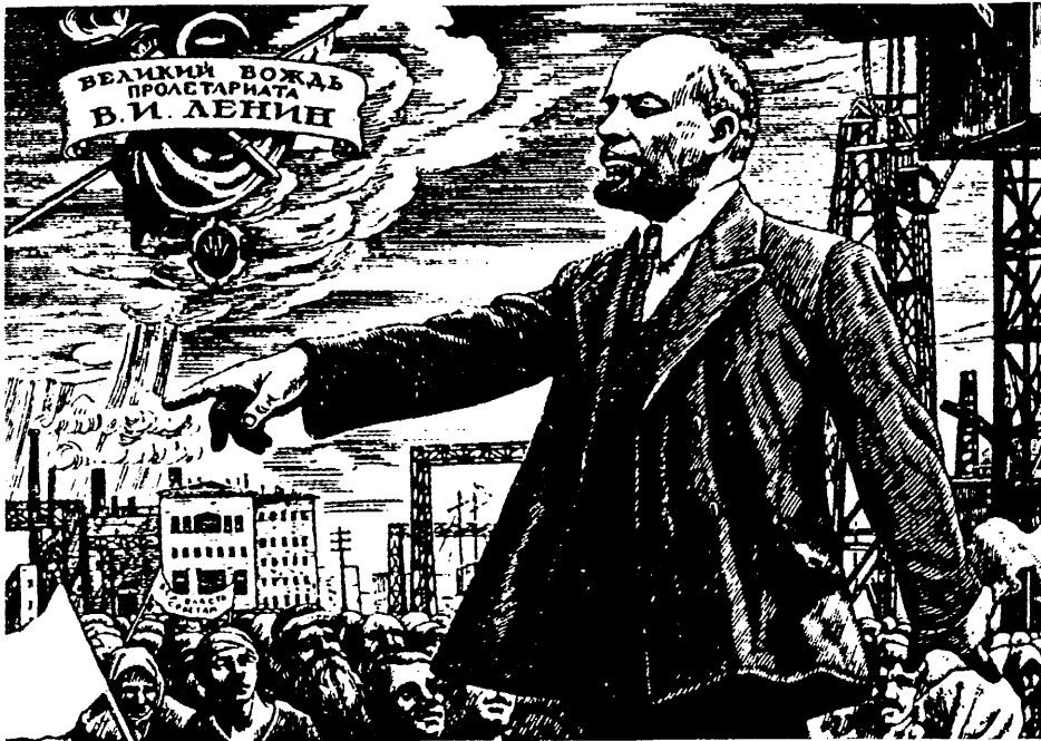
Fragmento del grabado de P. Shillingovski "Vladimir Ilich Lenin, gran guía del proletariado". Trabajo de los años 20

desarrolla, en virtud del crecimiento de las fuerzas productivas, otro superior, como del feudalismo, por ejemplo, nace el capitalismo.