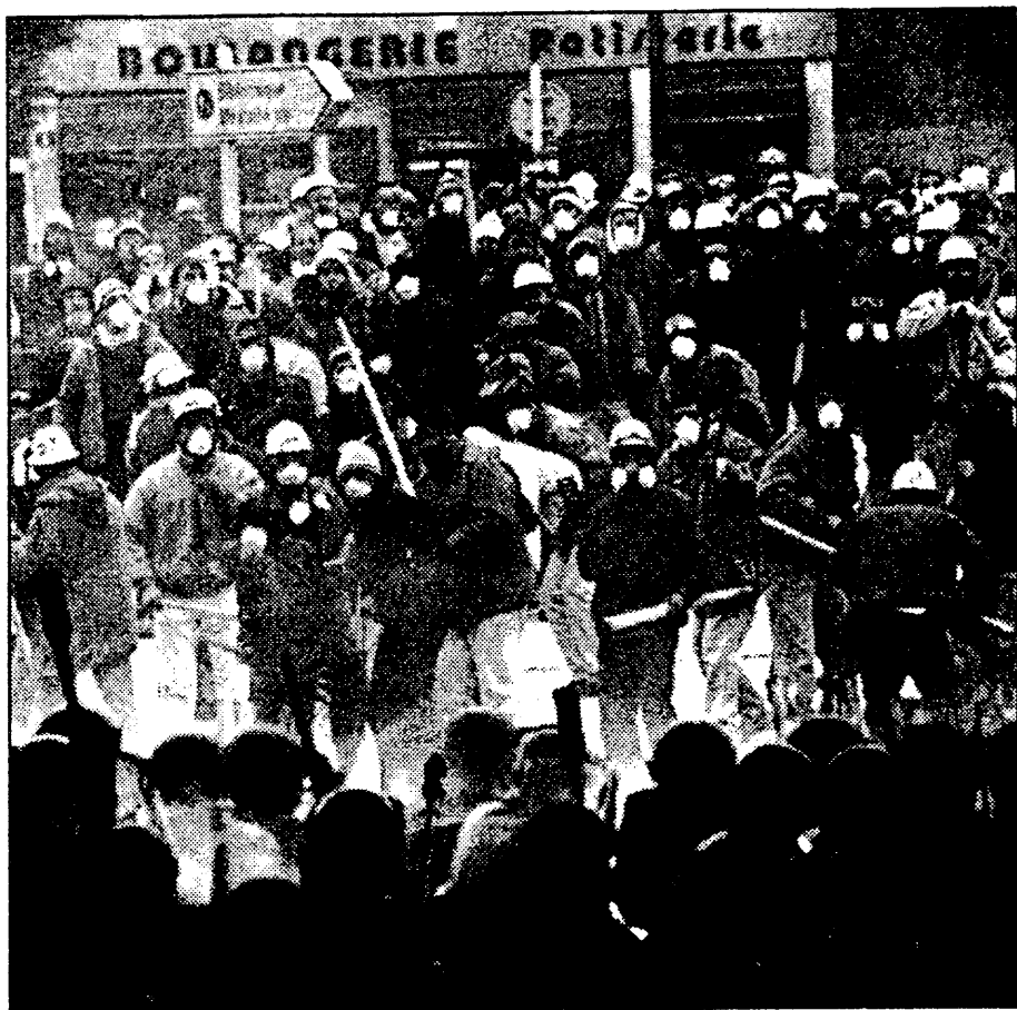
Un grupo de mineros franceses frente al cordón policial

piquetes se han presentado a pecho descubierto ante la policía. Para los comunistas, ahora, el valor de la huelga está, precisamente, no en su seguimiento cuantitativo, sino en la calidad de los obreros que han formado los piquetes, es decir, en la vanguardia de la clase, porque esta vanguardia es la materia prima que forjará el Partido Comunista.