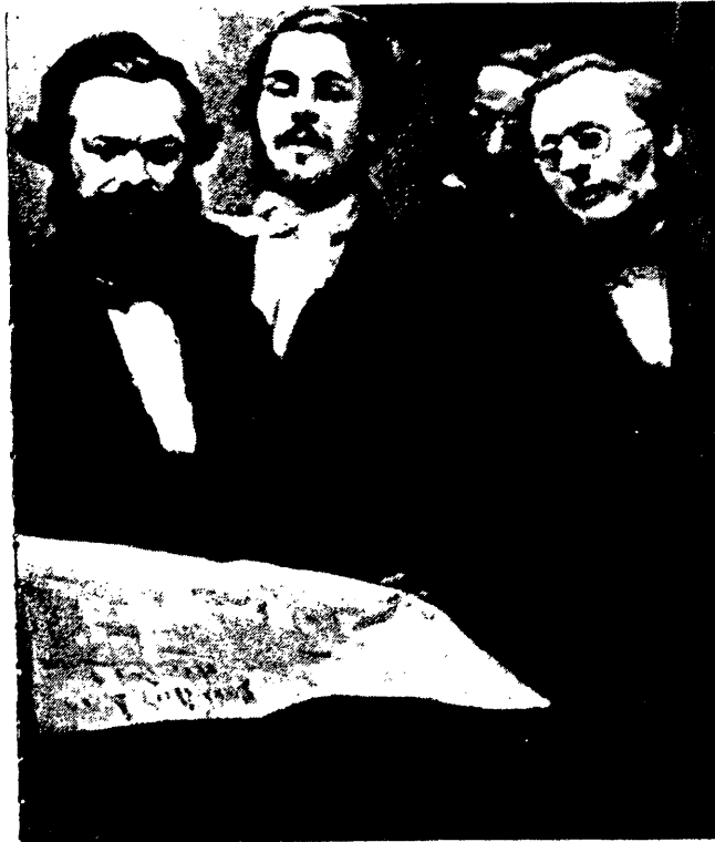
Carlos Marx y Federico Engels

por conciliar al movimiento obrero con la religión, se niegan a hacer propaganda ateísta y, teniendo a los proletarios en la consideración de necia mano de obra, sólo les hablan de lo "posible", lo "realista", lo "com