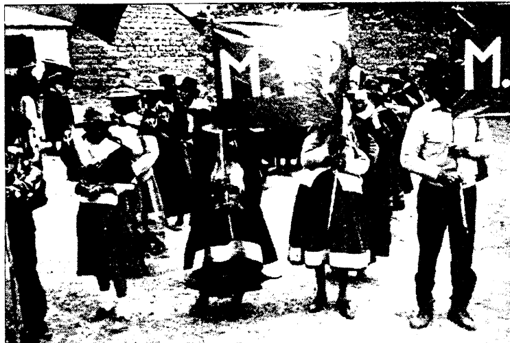
Movimiento Femenino Popular (MFP)