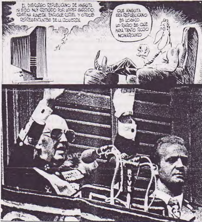
El rey J. Carlos, junto a Franco, durante la celebración del 39 aniversario de la sublevación fascista.

mente controlada por las promesas y discursos de personajes como el Sr. Anguita (traidores a la clase que dicen defender).