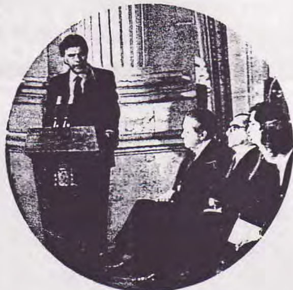
Firma de la adhesión de España a la CE.

En el seno de la clase dominante, dos grandes grupos o fracciones de clase se destacan. De un lado, la gran burguesía, la del capital financiero, cuya hegemonía determina el carácter monopolista, es decir, imperialista, del Estado Español. Junto a los banqueros y jerifaltes de las finanzas, habría que incluir aquí a los directores y gerentes de las grandes empresas y monopolios, a los altos cargos de la administración del Estado y de las Fuerzas Armadas y a los políticos que nos gobiernan (como dijera Marx, un gobierno burgues no es más que una junta de negocios de los capitalistas). El capital monopolista es el grupo más contrarrevolucionario, al constituir el eje del Estado actual y participar ávidamente de la explotación del Tercer Mundo, además de la del proletariado y demás clases oprimidas de España. Junto a la gran burguesía, la burguesía media, fundamentalmente industrial, que depende del