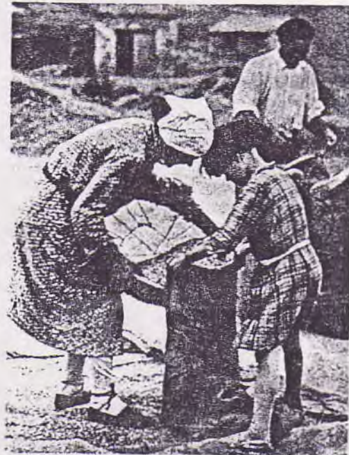
La cribadora riojana trabaja por seis reales de jornal y una mala comida. (Crónica. 1931)

Hasta la II República (1931-39), último intento de la débil burguesía industrial y de la burguesía media, apoyada por el proletariado y la pequeña burguesía, de trastocar las condiciones del modelo de hegemonía de clase impuesto -proyecto que, si bien no trató en principio de sobrepasar el marco burgués-capitalista, pronto puso en el orden del día la necesidad de la revolución dirigida por el proletariado y la transformación de la lucha de clases en guerra civil revolucionaria (1936-39)-, el modelo de acumulación capitalista siguió dependiendo de una agricultura atrasada (nula mecanización, técnicas de