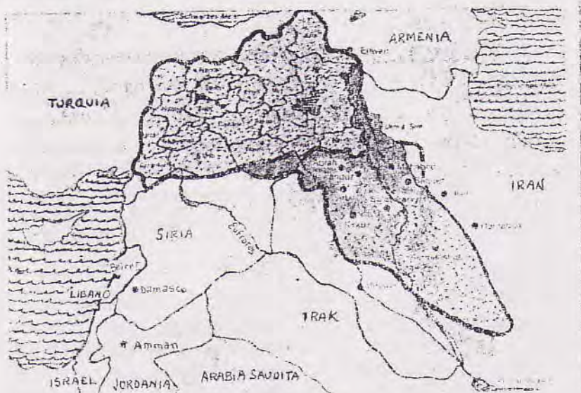
Territorio del Kurdistán

El avance turco encontró gran resistencia y se dio una emigración en masa hacia Anatolia. En el siglo XVI,